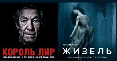
АКРАМ ХАН КОРОЛЬ ЛИР ЖИЗЕЛЬ УИЛЬЯМ ШЕКСПИР В ГЛАВНОЙ РОЛИ ИОН МАККЕЛЛЕН НОВАЯ ЖИЗНЬ ЗНАМИТОЙ ИСТОРИИ

Бронирование билетов: 8(4112) 31-88-50 www.kino.ykt.ru www.afisha.ykt.ru