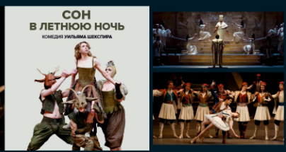
СОН В ЛЕТнюю НОчь КОМЕДИЯ УИЛЬЯМА ШЕКСПИРА