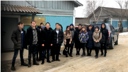
Второй год подряд отдел молодежи и семьи управления культуры, молодежи, семьи и спорта Олекминской районной администрации совместно с Центром занятости населения, управлением образования и Центром психологической поддержки реализует проект «Мой выбор: для учащихся выпускных классов городских и сельских школ, Олекминского техникума».