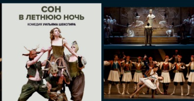
СОН В ЛЕТнюю НОЧЬ КОМЕДИЯ УИЛЬЯМА ШЕКСПИРА

CINEMA CENTER КИНОТЕАТР с 24 сентября по 31 декабря 2019 года