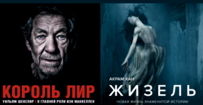
АКРАМ ХАН КОРОЛЬ ЛИР ЖИЗЕЛЬ УИЛЬЯМ ШЕКСПИР В ГЛАВНОЙ РОЛИ ИОН МАККЕЛЛЕН НОВАЯ ЖИЗНЬ ЗНАМИТОЙ ИСТОРИИ

Бронирование билетов: 8(4112) 31-88-50 www.kino.ykt.ru www.afisha.ykt.ru