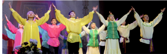
Юбилейные мероприятия, посвященные 25-летию Мирнинского политехнического института (филиала) Северо-Восточного федерального университета, начались со II межрегиональной научно-практической конференции и закончились торжественным собранием во Дворце культуры «Алмаз».