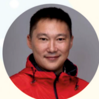
Автор: Алексей Алексеевич КЫЧКИН, фото предоставлено центром «Абитуриент», ВГУЭС